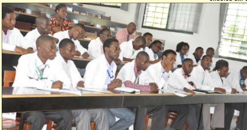
Viongozi wa Serikali ya Wanafunzi wa Chuo Kikuu cha Sayansi za Tiba cha Mt. Fransisi (SFUCHAS) wakisikiliza maelezo yaliyokuwa yanatolewa na Afisa wa Bodi aliyekuwa ametembelea Chuo hicho Desemba 10, 2012.