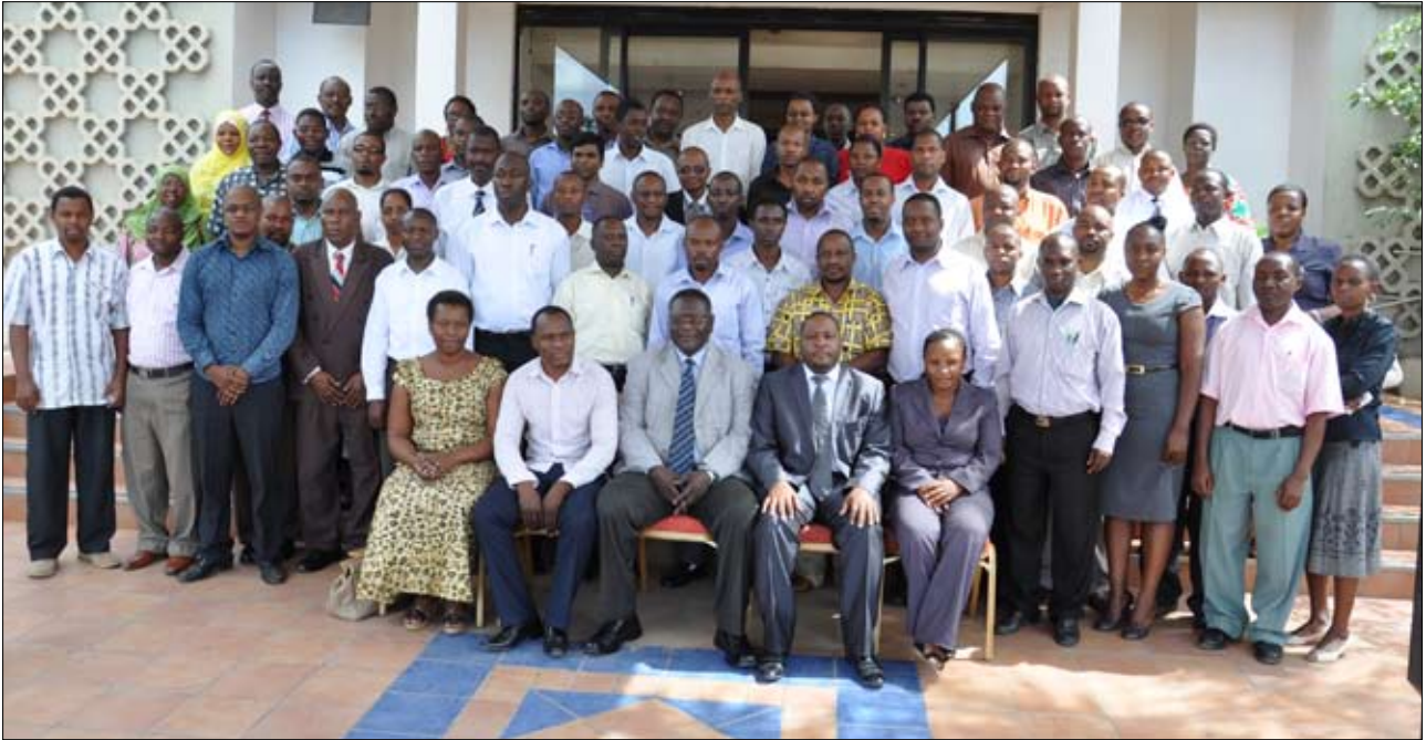
Maafisa wa Madawati ya Mikopo katika Taasisi za Elimu ya Juu wakiwa katika picha ya pamoja baada ya ufunguzi rasmi wa mkutano na Bodi uliofanyika Oktoba 11, 2012 katika Hoteli ya Blue Pearl, Ubungo Plaza, Dar es Salaam.