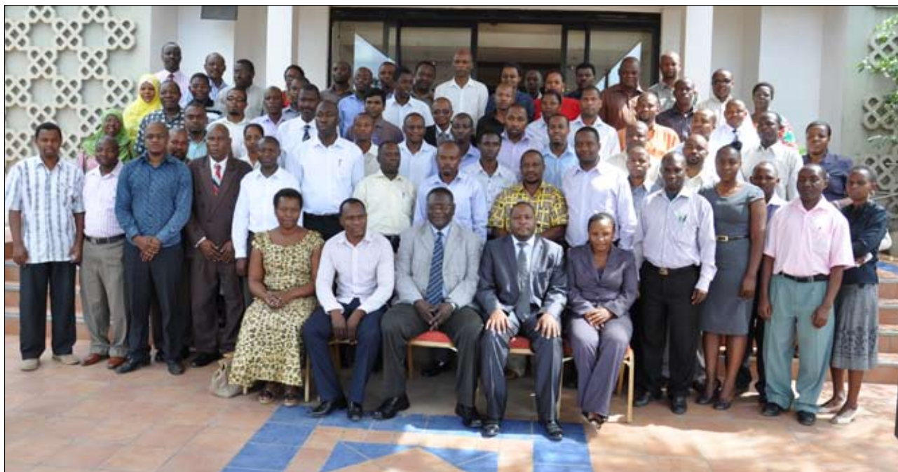
Maafisa wa Madawati ya Mikopo katika Taasisi za Elimu ya Juu wakiwa katika picha ya pamoja baada ya ufunguzi rasmi wa mkutano na Bodi uliofanyika Oktoba 11, 2012 katika Hoteli ya Blue Pearl, Ubungo Plaza, Dar es Salaam.