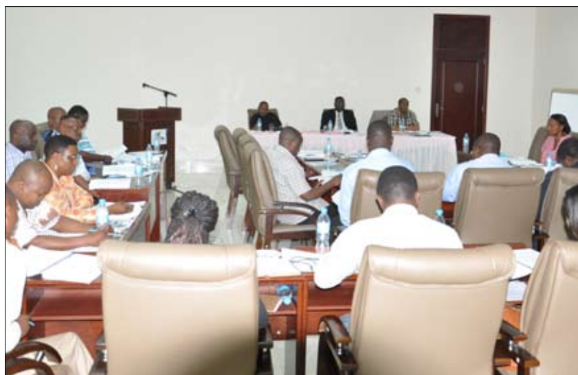
Baadhi ya wajumbe wa Baraza la Wafanyakazi wa Bodi wakishiriki katika mkutano uliofanyika Oktoba 20, 2012 katika Hoteli ya Oceanic Bay Resort, Bagamoyo.

Kuna mambo mawili muhimu ya kuzingatia katika masuala ya mikopo ya wanafunzi wa elimu ya juu: moja, ni jinsi ya kuipata, na pili ni namna kurejesha mikopo hiyo muda unapowadia. Katika maana halisi; Urejeshaji mikopo ni kulipa kiasi cha fedha alichokopeshwa mtu kwa masharti fulani. Hiki ndicho kinachotokea kwa wanafunzi wa elimu ya juu ambao hukopeshwa fedha na Bodi ya Mikopo ya Wanafunzi wa Elimu ya Juu kwa ajili ya kugharamia masomo yao katika